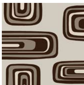
Vanguardia 160 x 200