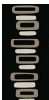
Piedras 200 x 80