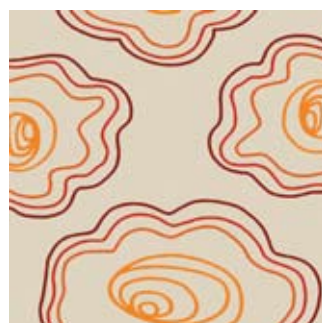
Margarita 200 x 250