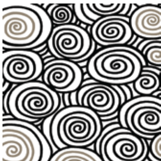
Firulete 160 x 200