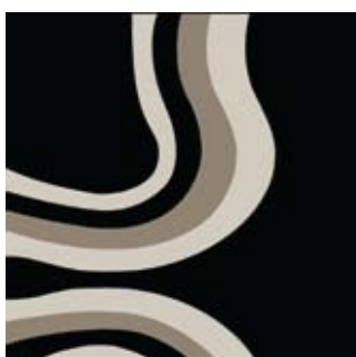
Rios 200 x 250