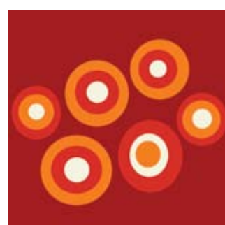
Solar 160 x 200