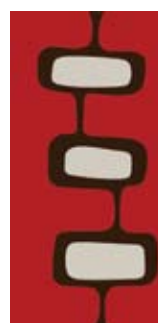
Dominó 160 x 65